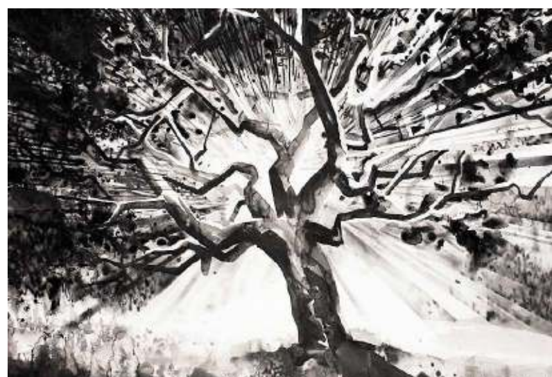
Nik Christensen, 'Sleep Patterns', 2011. Sumi-inkt op papier