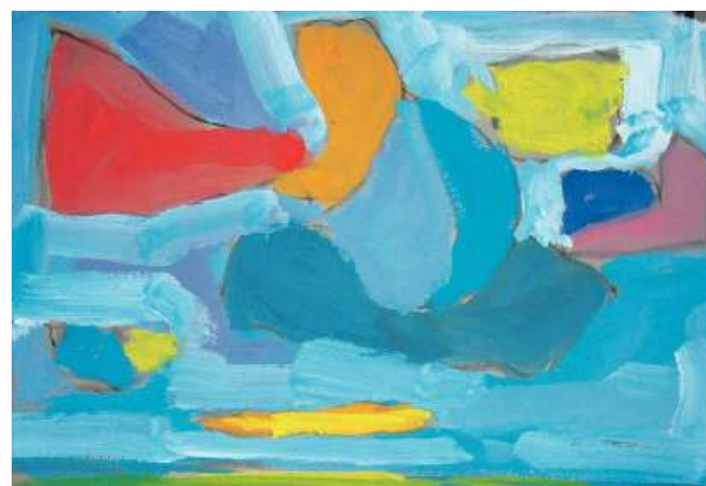
Gerrit Benner, 'Voorjaarslandschap', circa 1970. Gouache op karton